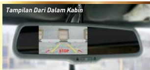
Tampilan Dari Dalam Kabin

*Gambar hanya sebagai ilustrasi, penggunaan aktual bisa disesuaikan dengan kebutuhan masing-masing.