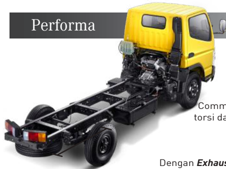
Rear Over Hang (ROH) 2M