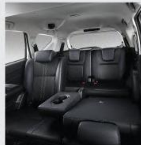
Spacious Third Row Seats