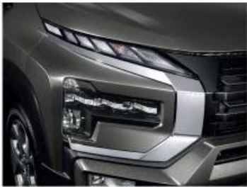
NEW T-Shape Headlamp

The New Xpander Cross hadir dengan tampilan lebih kokoh dan interior yang nyaman serta dilengkapi fitur baru yang canggih untuk bangkitkan petualangan seru dalam hidup Anda.