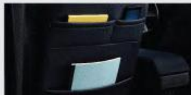
Multifunction Seat Back Pocket (Driver + Passenger)