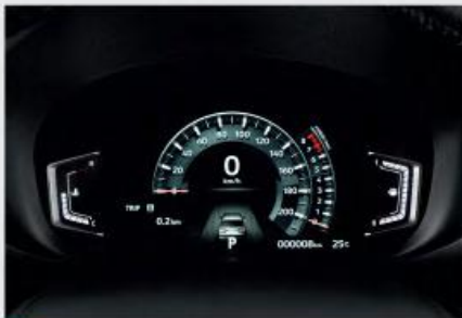
NEW 8inch LCD Meter Cluster