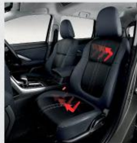
Dual Tone Synthetic Leather Seat with Heat Guard*