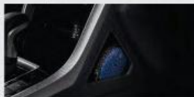
Instrument Panel Side Pocket