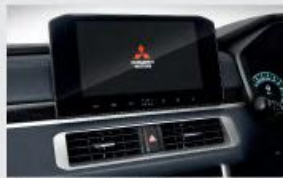
9inch Audio Head Unit with Smartphone Connectivity