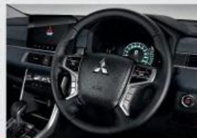
NEW Steering Wheel Design with Heat Guard*