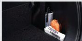
Rear Luggage Compartment