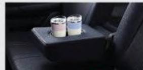
2 nd Row Armrest with Cup Holder