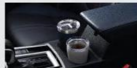
Front Cup Holder*