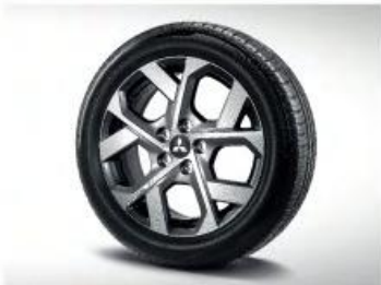
NEW 17Inch Alloy Wheel Design