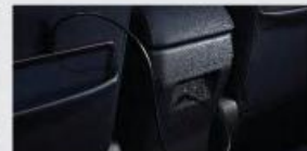
2 nd Row USB Port*