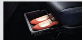
Seat Under Tray