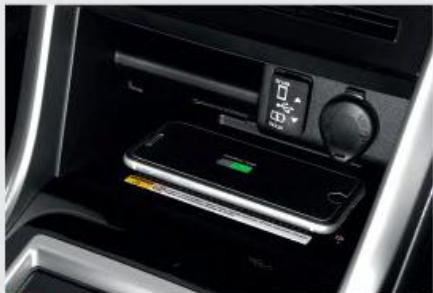
NEW Wireless Charger