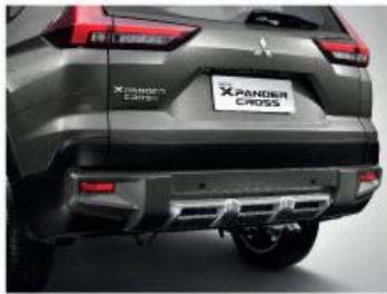
NEW Rear Powerful Bumper Design