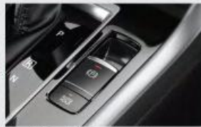
Electric Parking Brake with Brake Auto Hold*