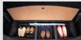
Underfloor Luggage Area Storage