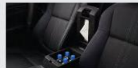
Closed Storage Box*