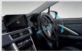
Tilt & Telescopic Steering