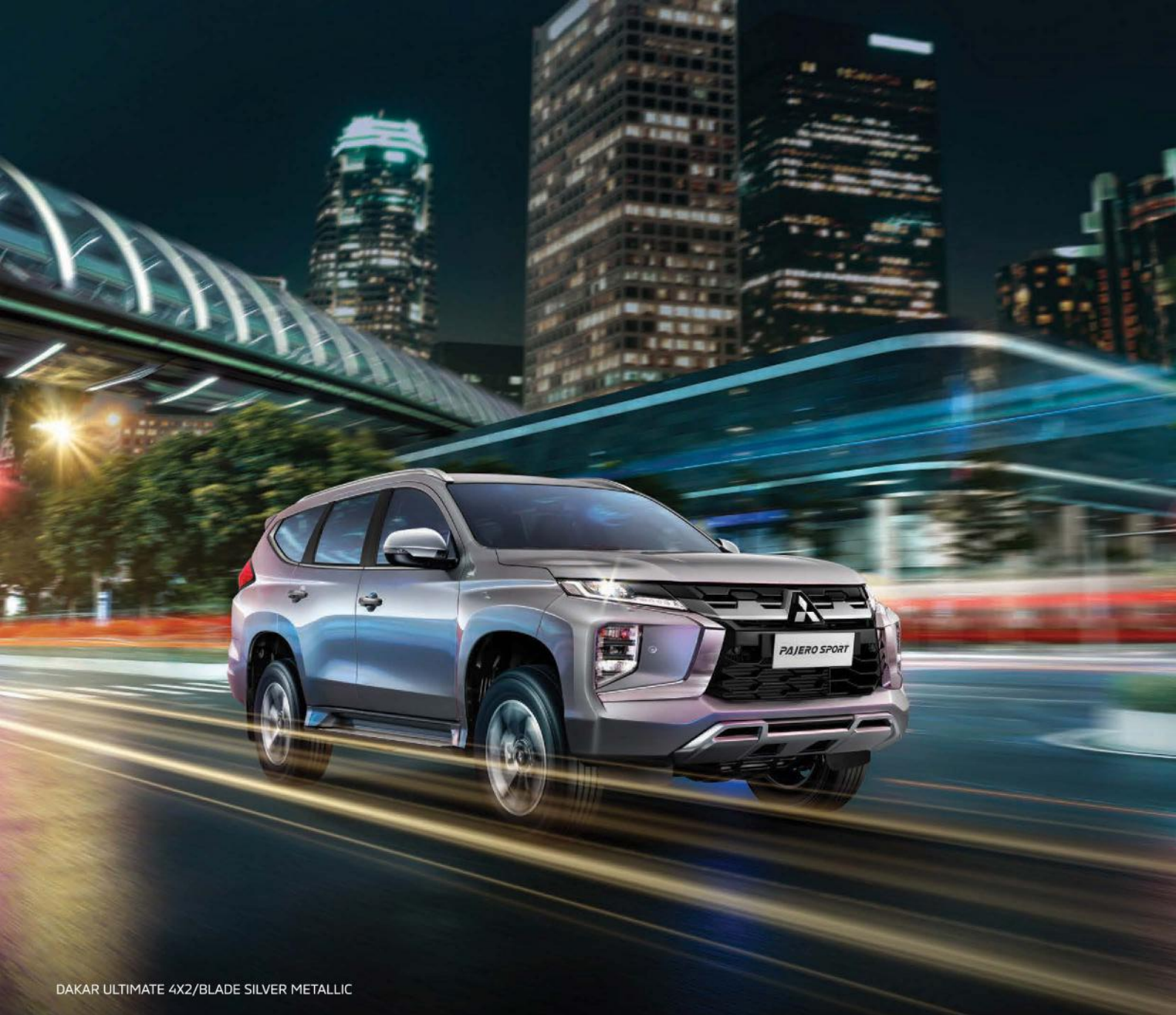
DAKAR ULTIMATE 4X2/BLADE SILVER METALLIC