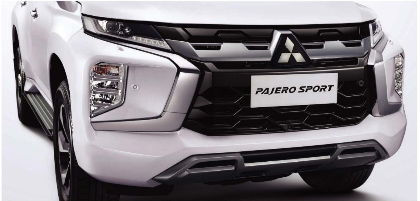
NEW FRONT GRILLE & UNDER GARNISH

Experience enhanced robustness for a bolder presence.