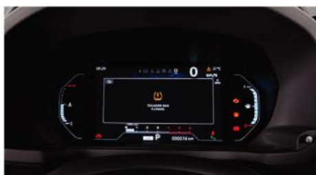
TIRE PRESSURE MONITORING SYSTEM (TPMS) 1