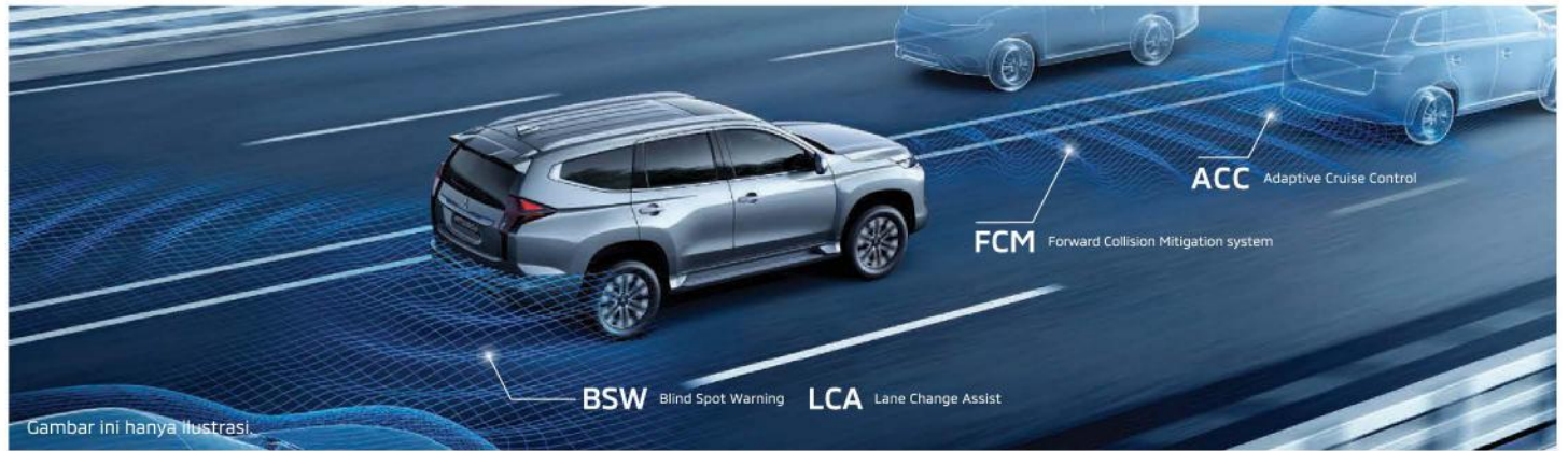
Gambar ini hanya ilustrasi.