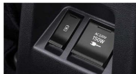
AC POWER OUTLET 220V/150W 2