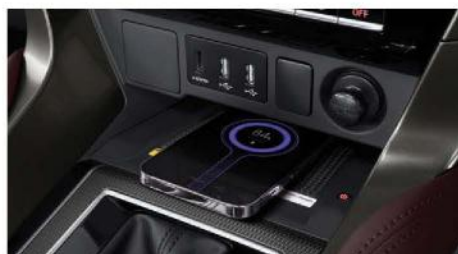
WIRELESS CHARGER 1