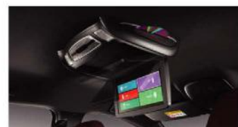
ENTERTAINMENT SYSTEM WITH ROOF MONITOR 5