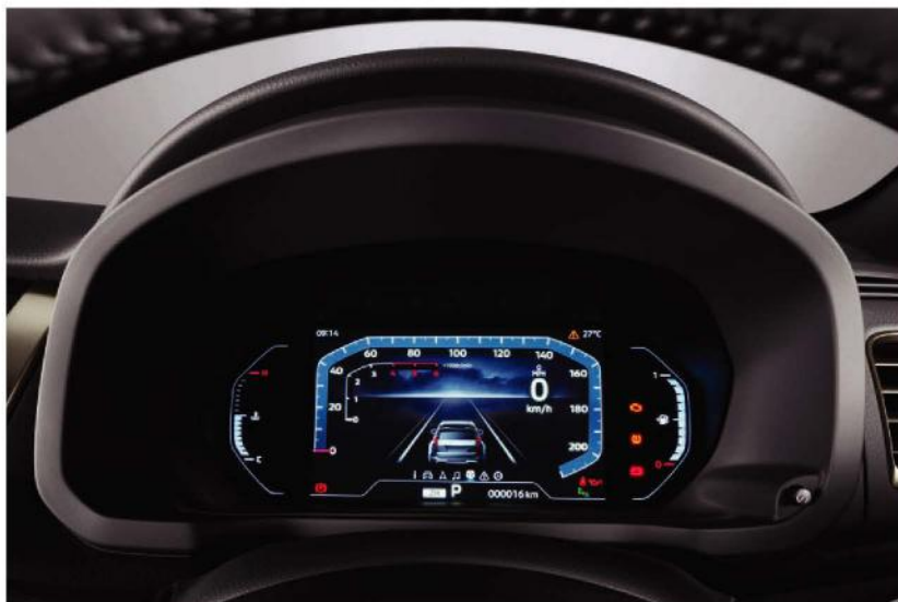
NEW 8 INCH DIGITAL DRIVER DISPLAY*

Redefining your driving experience with advanced technology.