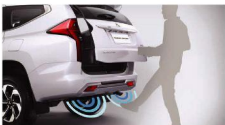
HANDSFREE POWER LIFTGATE WITH KICK SENSORS 2