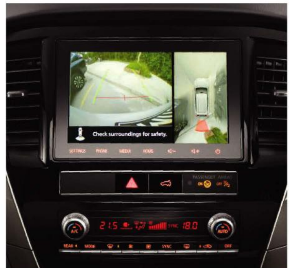
MULTI AROUND MONITOR*