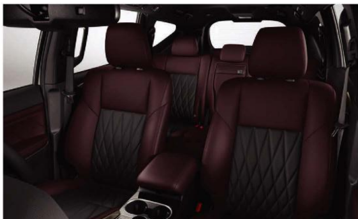
NEW BLACK AND BURGUNDY INTERIOR COLOR 2