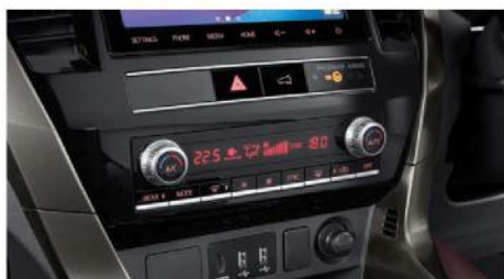
DUAL ZONE AC WITH NANO ™ X 1