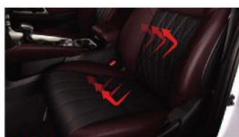
NEW SYNTHETIC LEATHER SEAT WITH HEAT GUARD 2