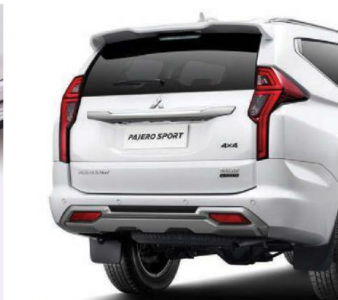
NEW REAR UNDER GARNISH