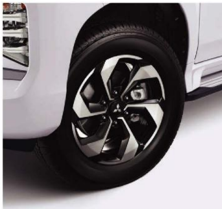
NEW 18 INCH ALLOY WHEEL DESIGN*