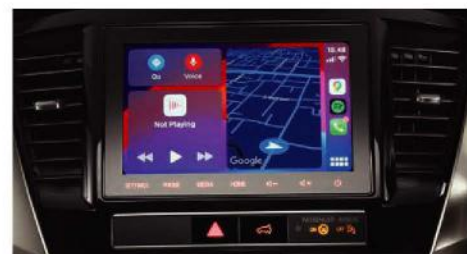
8 INCH SMARTPHONE-LINK DISPLAY AUDIO 1