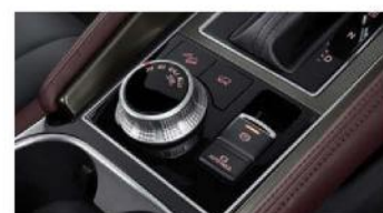
ELECTRIC PARKING BRAKE WITH BRAKE AUTO HOLD 1